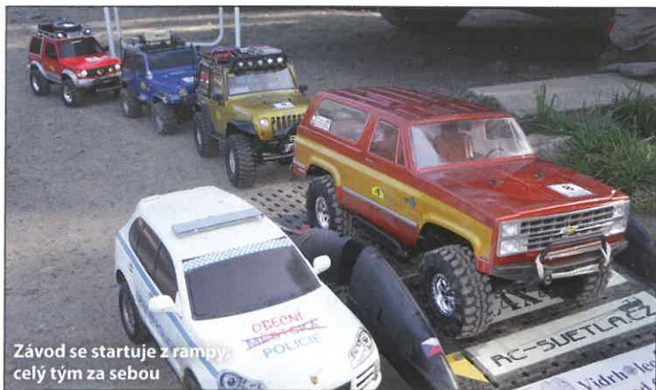
Závod se startuje z rampy, celý tým za sebou