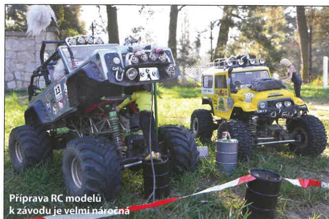
Příprava RC modelů k závodu je velmi náročná

ty závodu. Ke kontrolnímu bodu se dá dojet po cestě a až posledních několik desítek či stovek metrů odbočit do lesního terénu nebo lze jet přímoú trasou, a to někdy i houštím. Platí pravidlo, že tým se vždy sejde, respektive musí sejít u každého kontrolního bodu. Nejlepší je se sejít a jet společně. Rozhodující je čas projetí všech šestnácti checkpointů a dojet s RC modelem vlastní silou či nepojízdný model dotáhnout třeba na laně. Pomáhat rukama je zakázáno a znamená to diskvalifikaci. Samozřejmě výjimkou je oprava poškozeného modelu či výměna baterií. Náhradní baterie si závodník nese v batohu s pitím a svačinou. V lese se tráví celé dopoledne a někdy i celý den. Zajímavostí je také vyprošťování převrácených nebo zapadlých modelů navijákem.