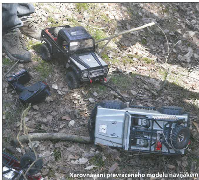
Narovnávání převráceného modelu navijákem