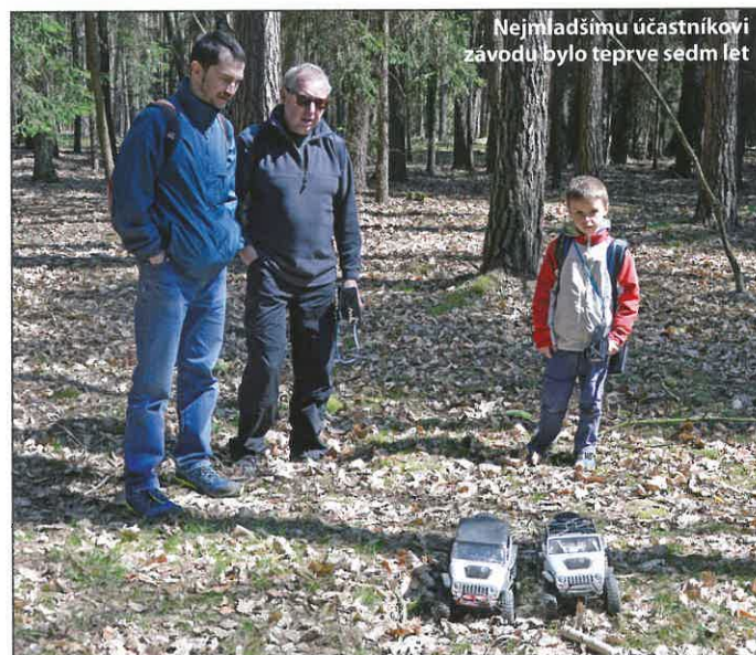
Nejmladšímu účastníkovi závodu bylo teprve sedm let