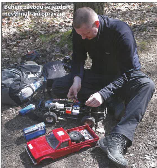
Během závodu se jezdeckové nevyhnuli ani opravám

Samozřejmě, že bylo zde i několik zajímavých míst pro fotografování. RC modely zde vynikly snad všechny. Lesní prostředí kromě klidu, ticha a nám v Praze tak vzácného čerstvého vzduchu nabízelo mnoho atraktivních míst