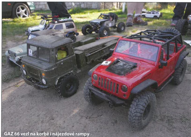
GAZ 66 vzal na korbě i nájezdové rampy