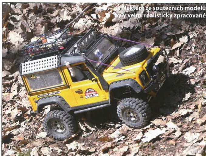
Některé ze soutěžních modelů byly velmi realisticky zpracované

Letošní ročník opět startoval od klánovického koupaliště. Zde je vstup do zalesněného prostoru nejbliže od parkoviště. Start byl zkušeným organizátorem Petrem Komárkem stylově odmáván každému týmu státní vlajkou. Start probíhal od deváté hodiny v desetiminutových intervalech. Startuje se z rampy a vždy