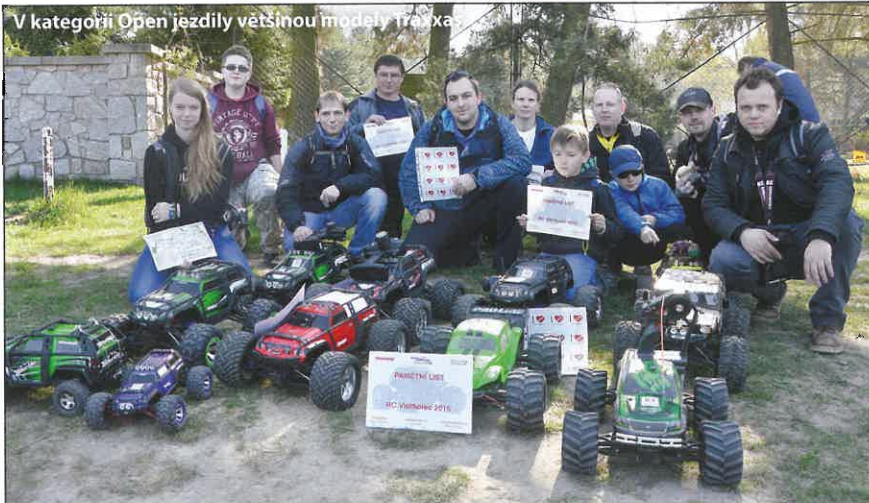
V kategorii Open jezdily většinou modely traxxa