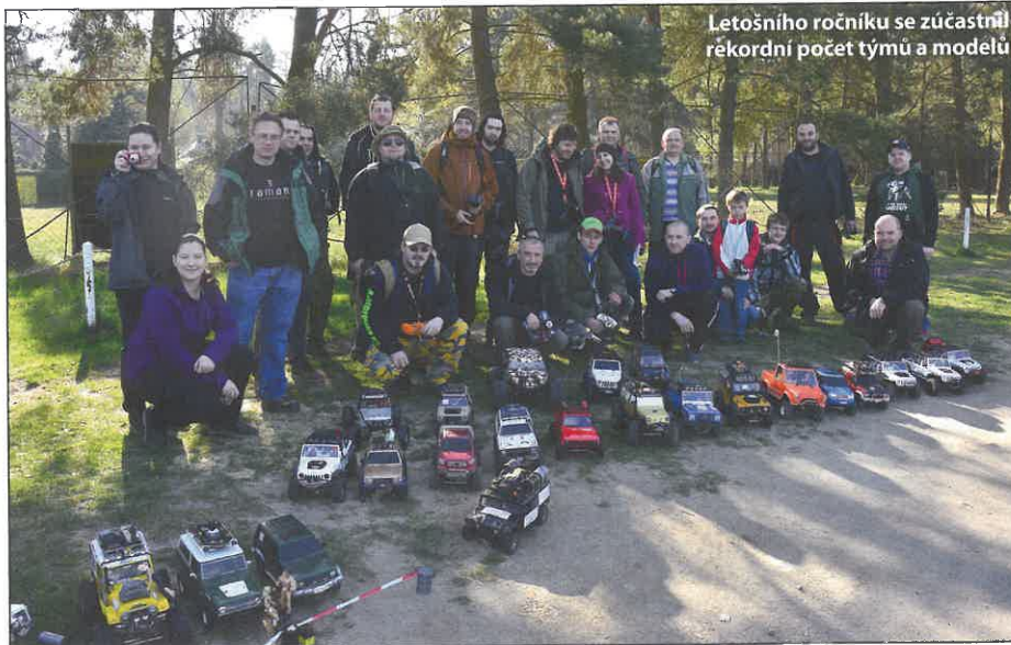
Letošního ročníku se zúčastnil rekordní počet týmů a modelů