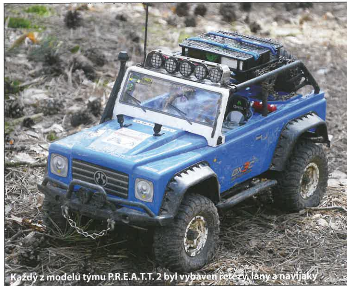
Každý z modelů týmu P.R.E.A.T.T. 2 byl vybaven řetězy, lany a navijáky

pro zachycení momentek. Některé modely přišly během závodu například o světlo, ale na krásě jim to nic neubralo.